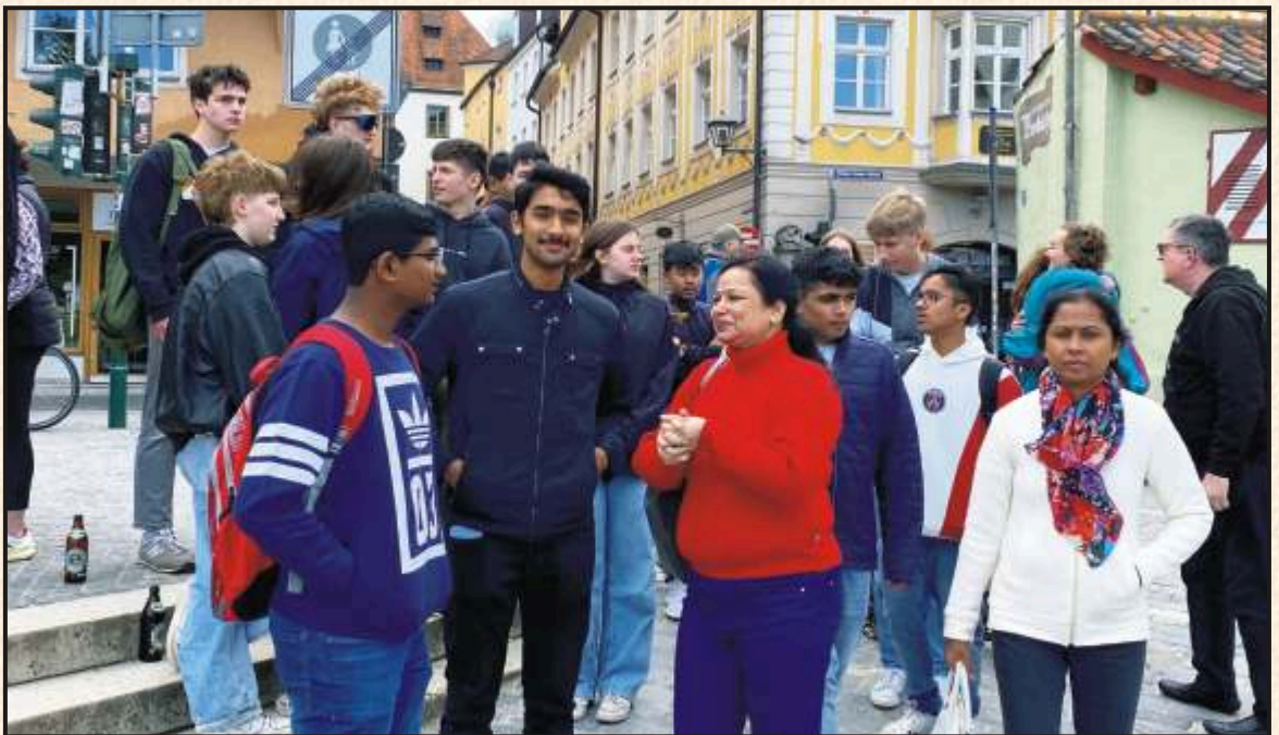
On our literary quest - Going to Museum, Walhalla