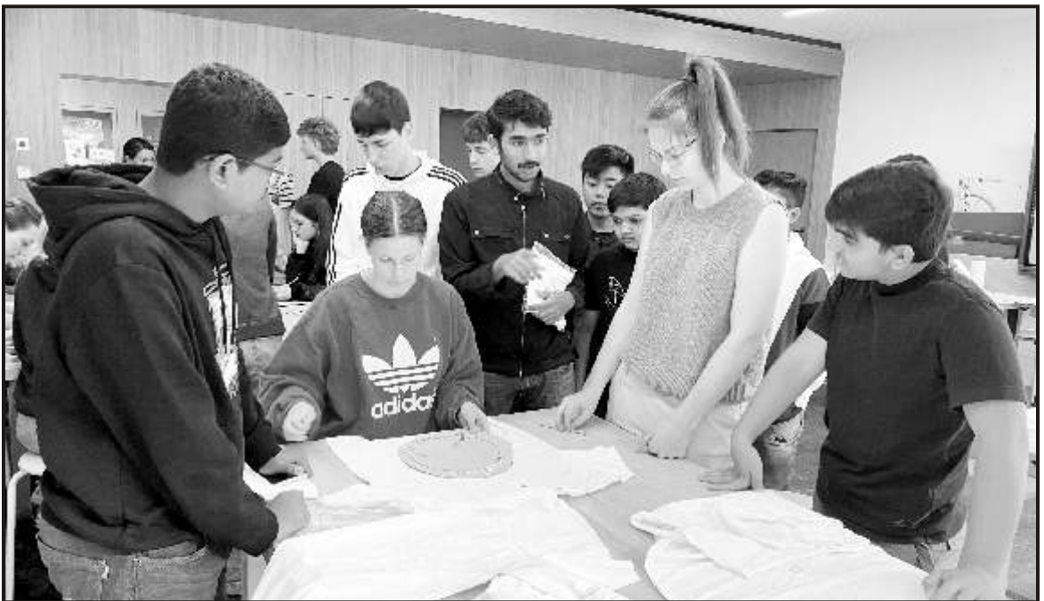
Designing our special farewell gifts