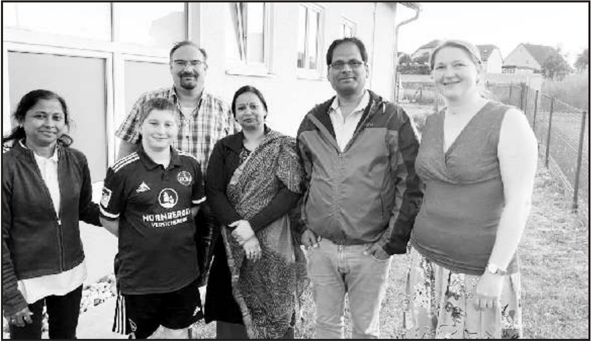
Home away from home with our German Colleagues