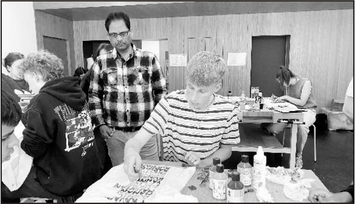
Special note of love by the Germans for Scindians