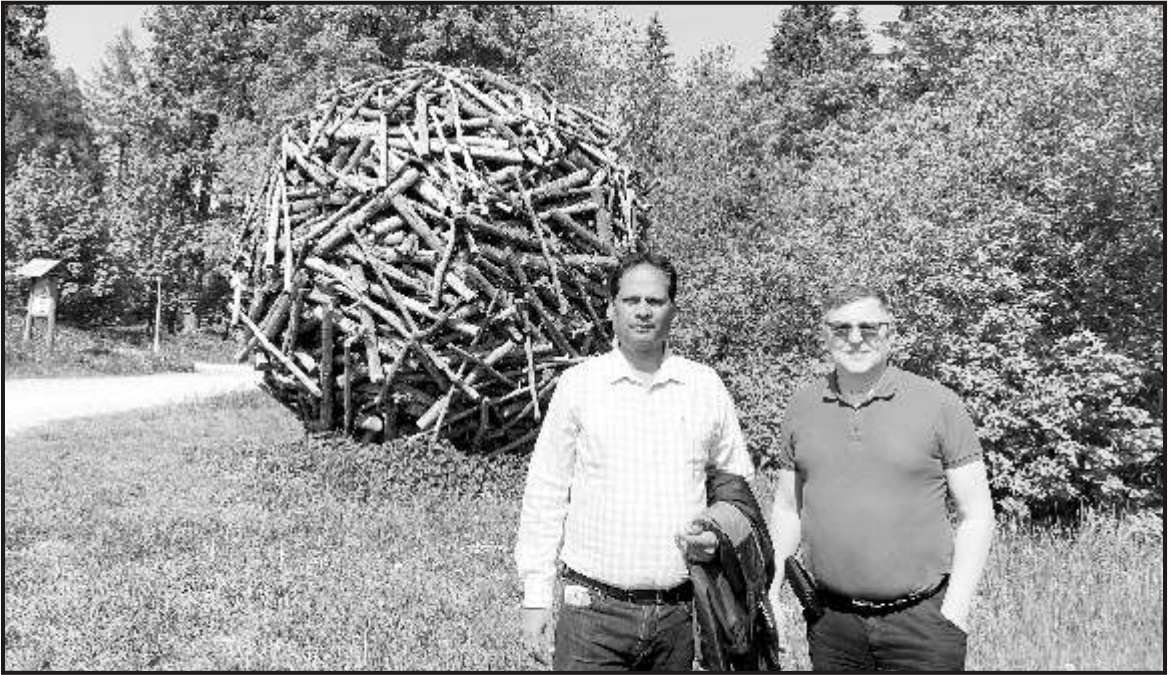
Enjoying in the woods