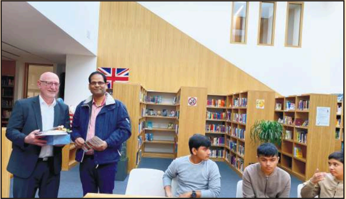
Felicitating the school principal at Waldnaab, Germany