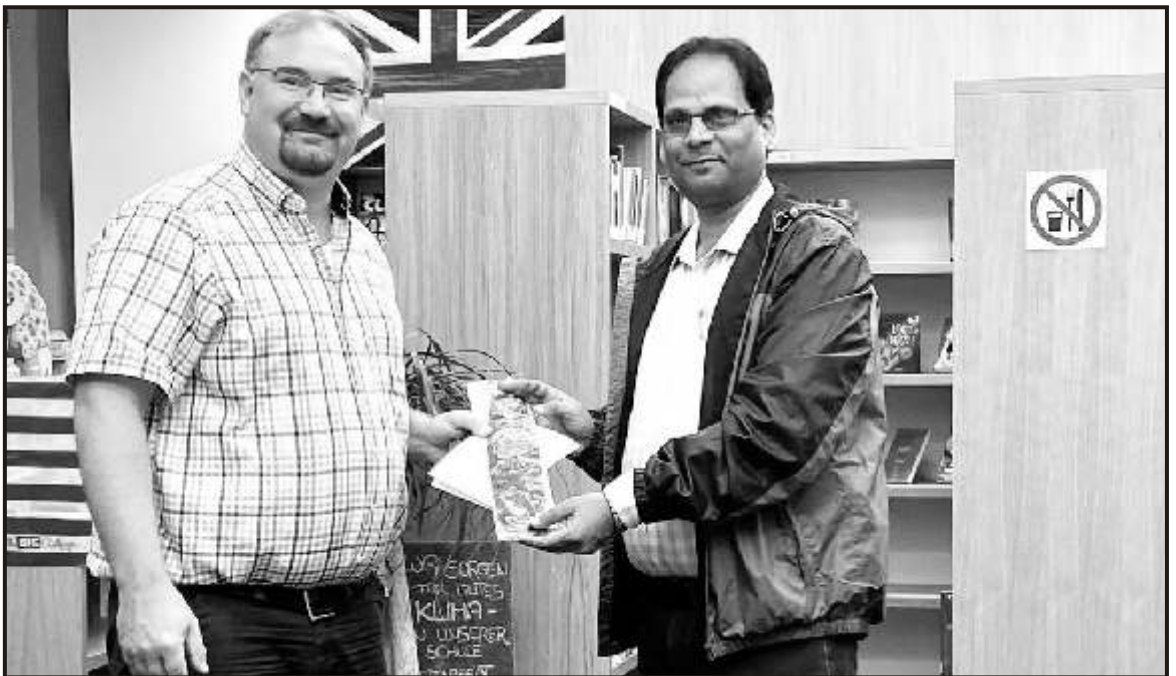
Token of love to German Friend