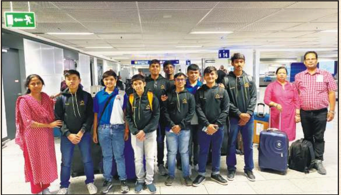
Hello From Frankfurt