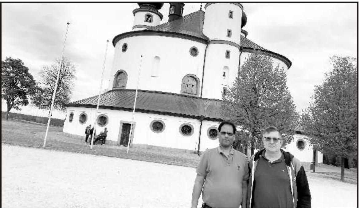
Visit to a picturesque church in Germany