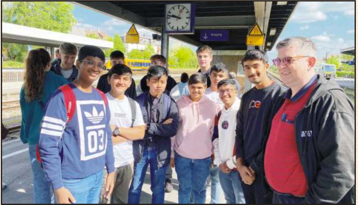
On the way to Alps - at Weiden Railway Station