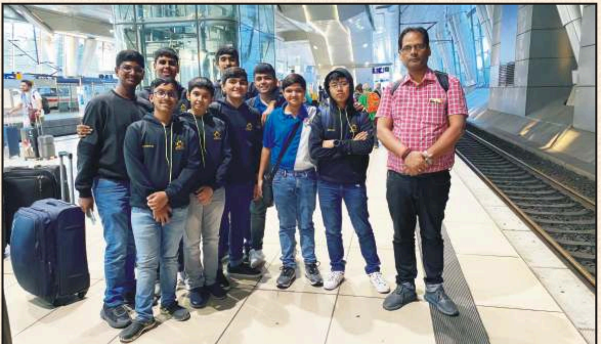
On the way to our Destination - Gymnasium Neustadt an der Waldnaab