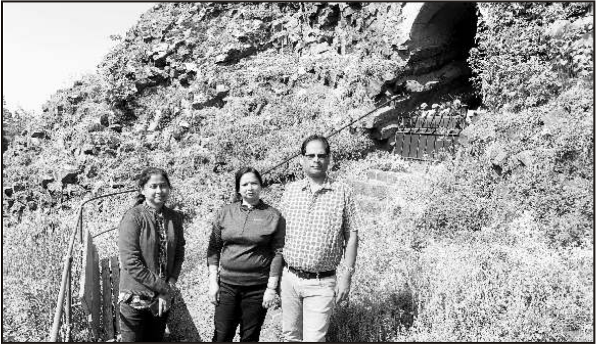
In the midst of dormant Volcanoes at Parkstein