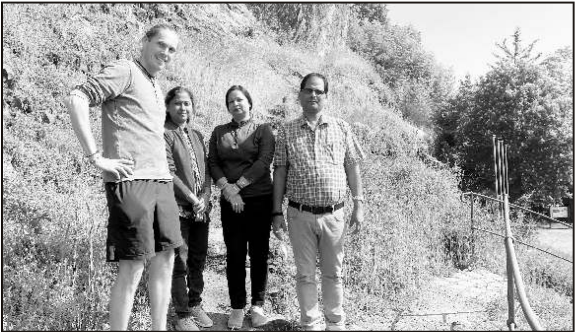
In the midst of dormant Volcanoes at Parkstein