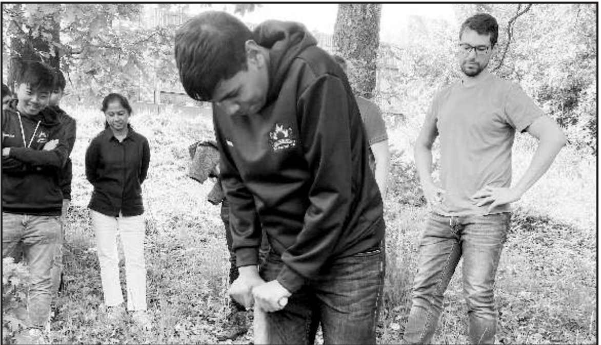
Taking the Scindian Legacy forward-Planting Trees in Gymnasium Neustadt