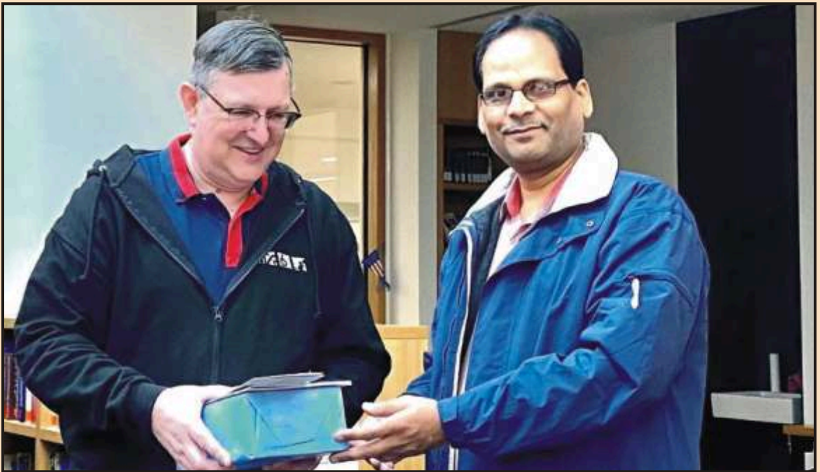
Meeting with the German Counter Part Exchange Coordinators