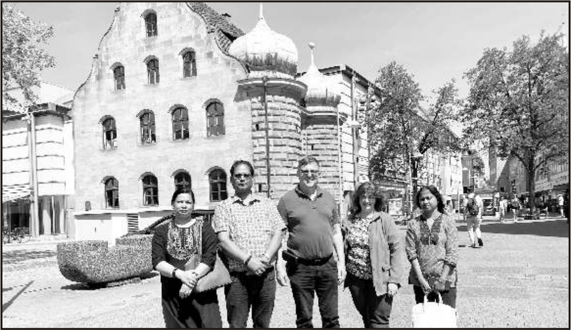
On our way back to India