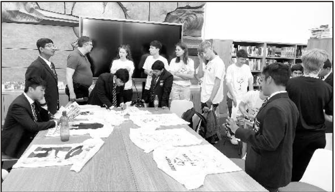
Time to bid adieu - till we meet again