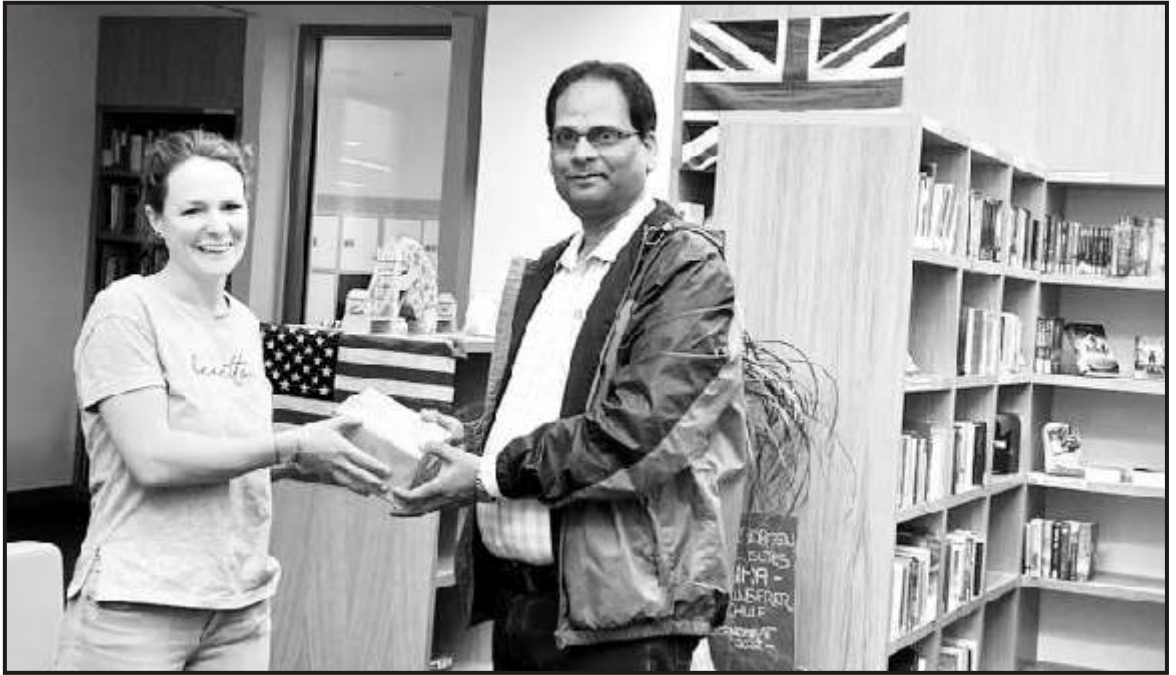
A gift of gratitude to art teacher