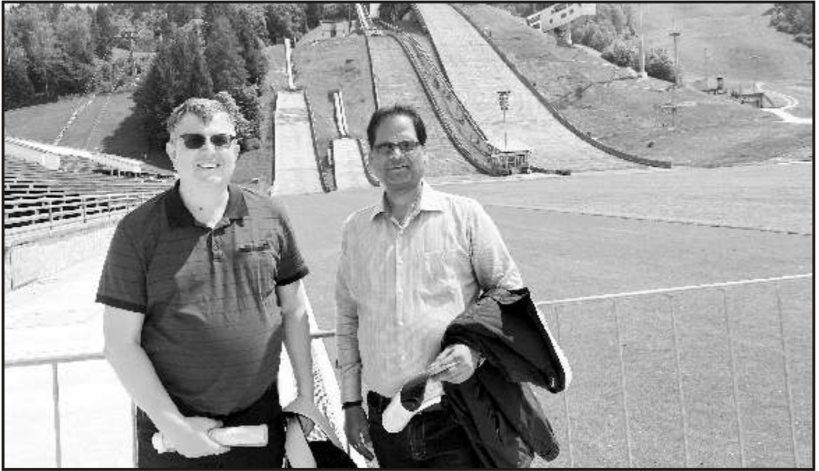
Enjoying the rink at Garmisch-Partenkirchen