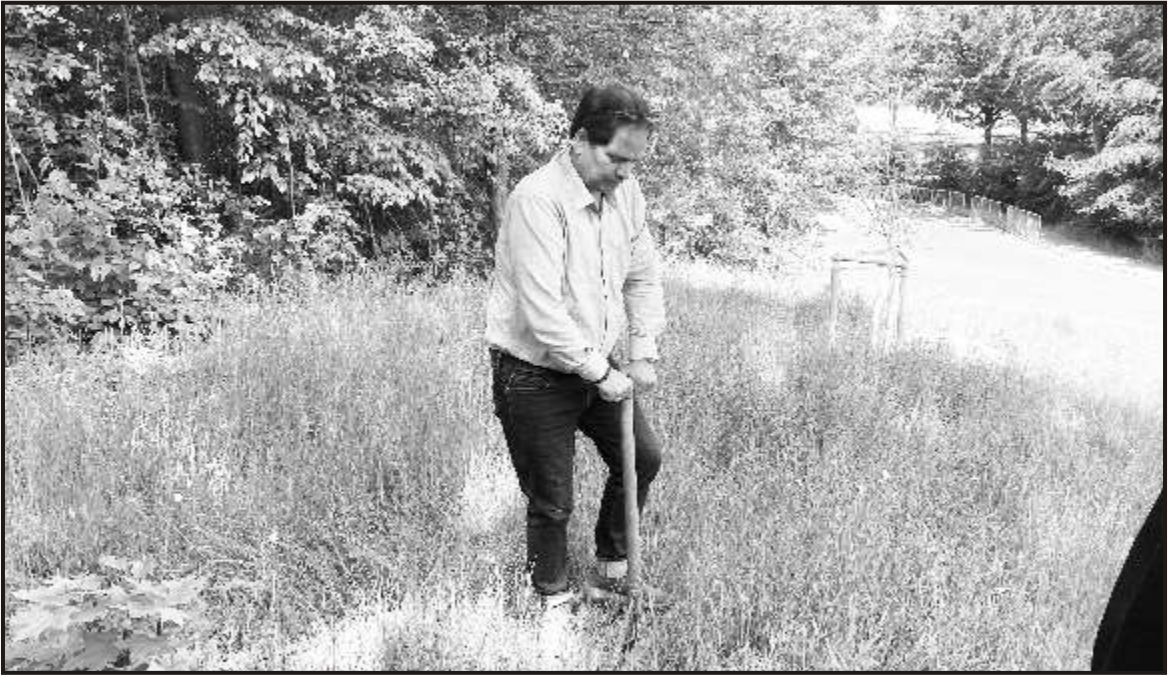
Taking the Scindian Legacy Global-Planting trees in Gymnasium Neustadt Waldnaab