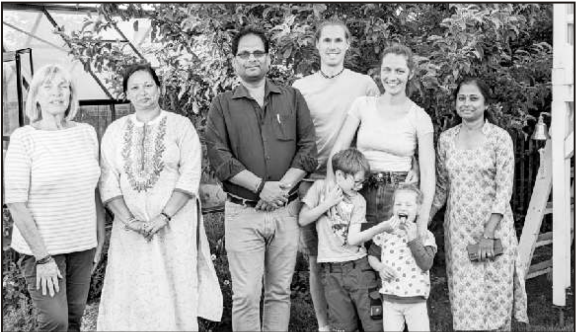
Home away from home - our host family