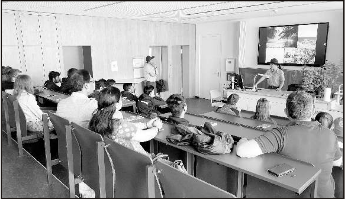
Talk by the Forest Officials