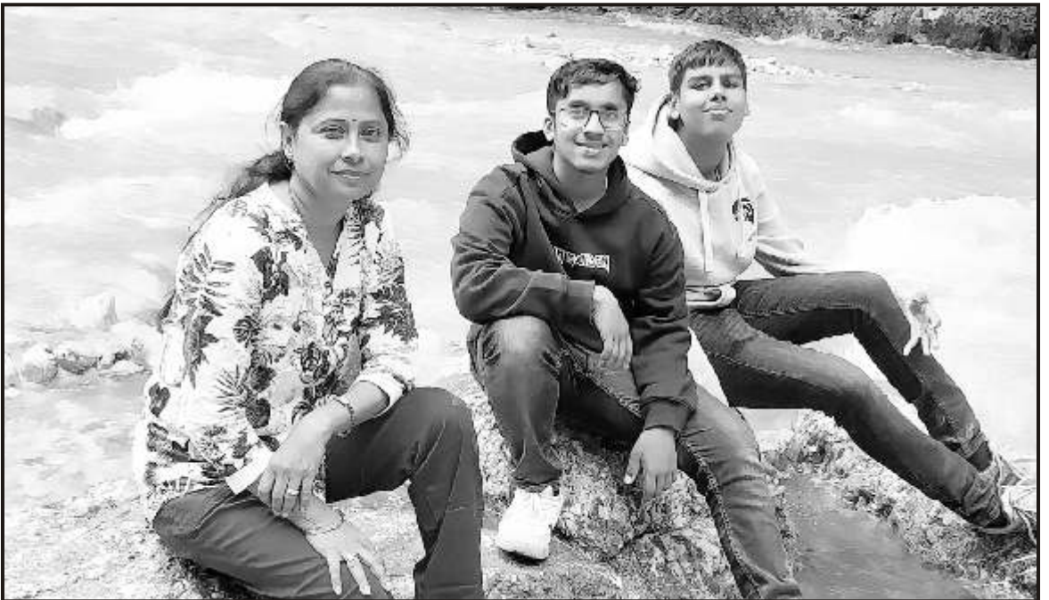
Enjoying the river side - Loisach River