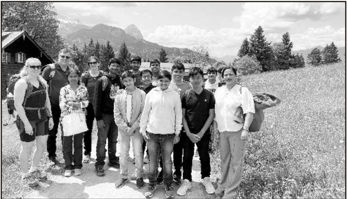
On the way to Alps