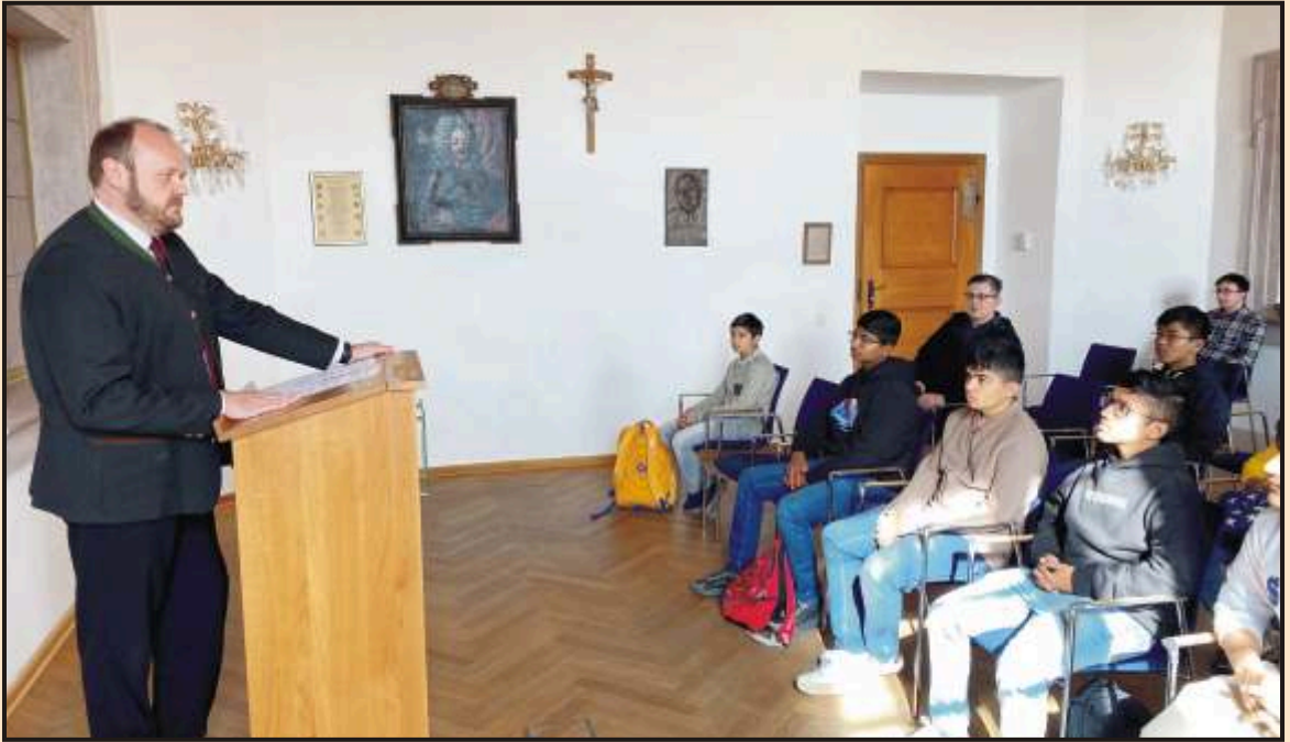
Address by the Mayor at Rathaus