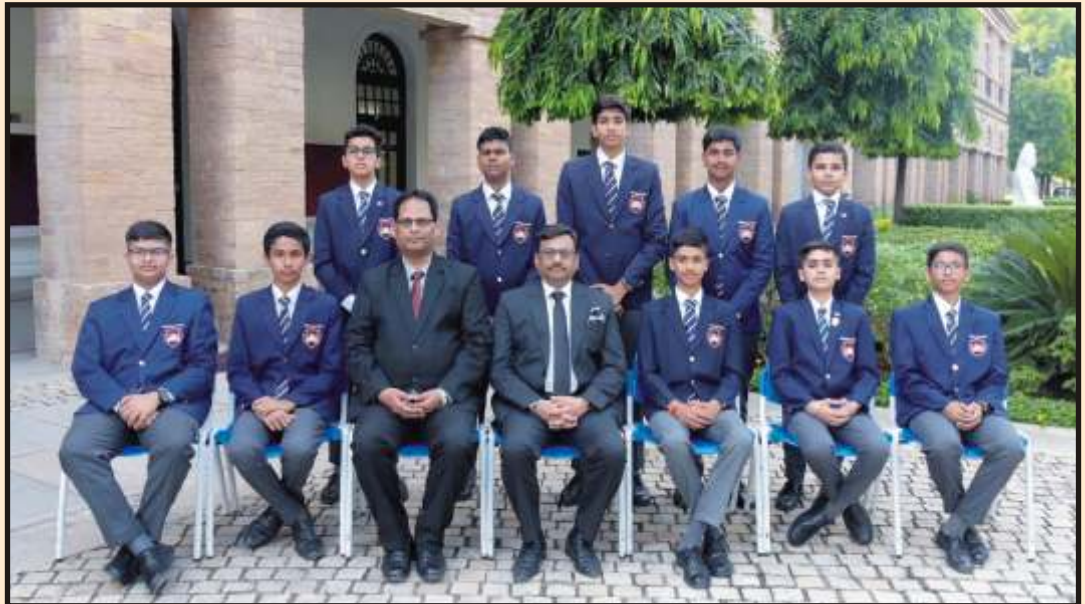
A Batch of 2027