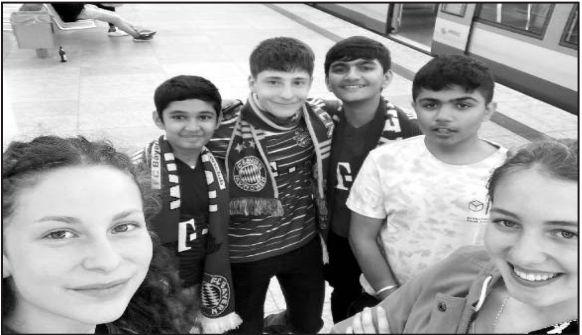
Eager to Enter Allianz Arena