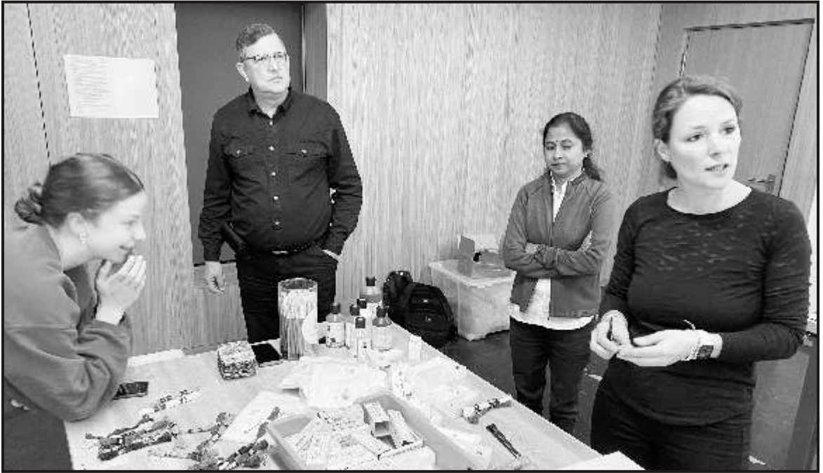
Brainstorming for the designs of T-Shirts