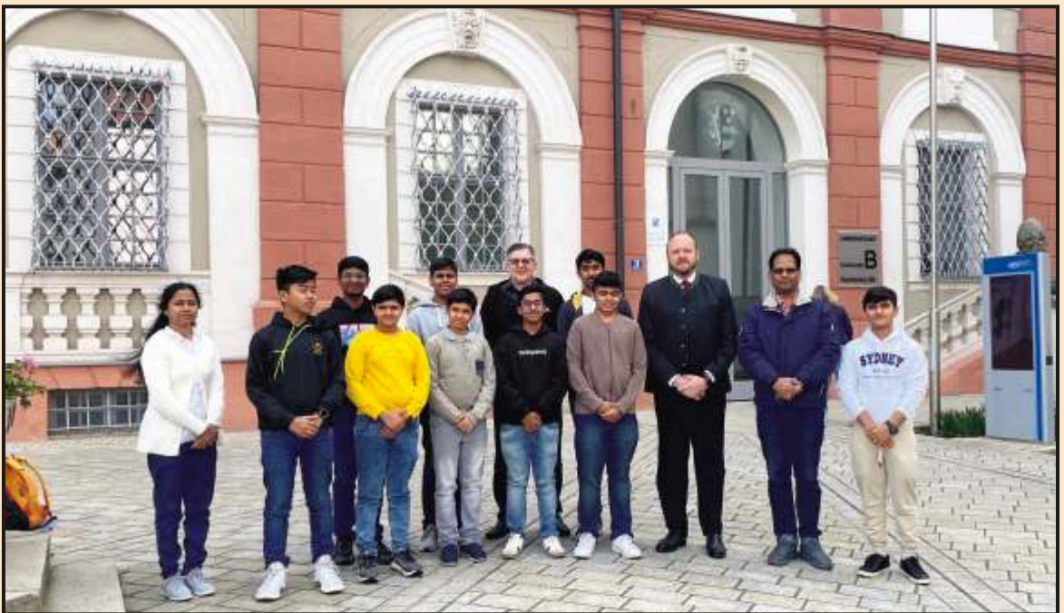
Capturing a moment with the Mayor in front of Rathaus