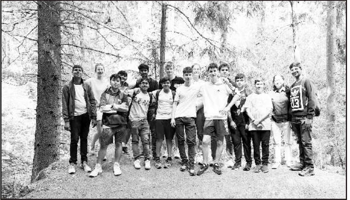
Moving in the woods, Dost, Germany