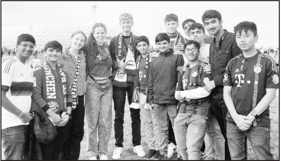
Football fever at the Allianz Arena