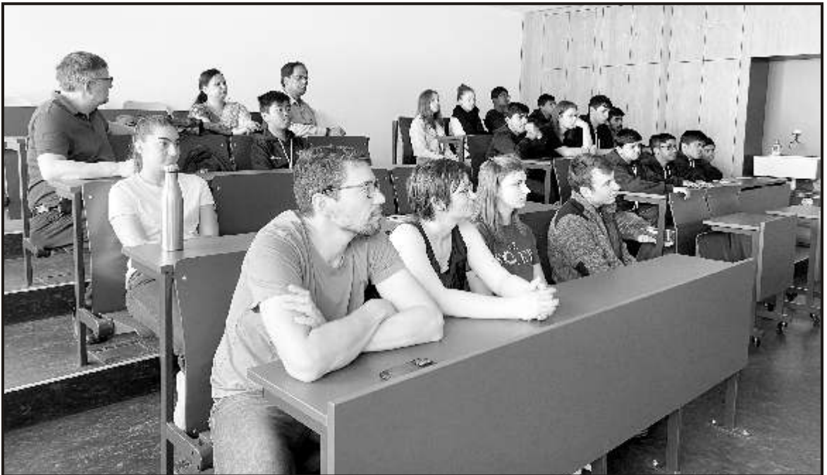
Talk by the Forest Officials